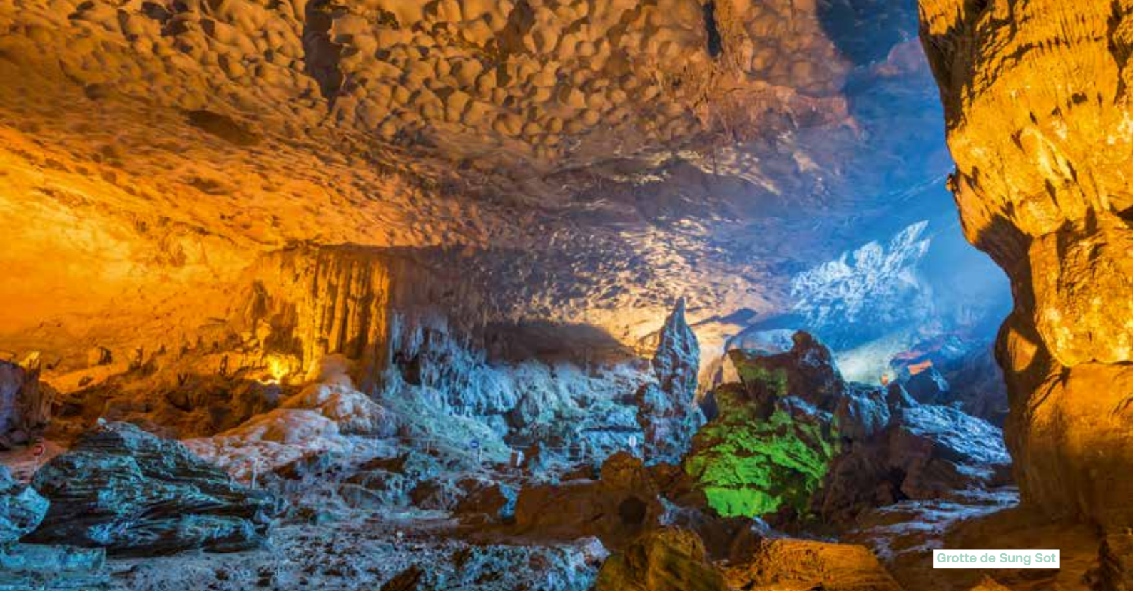
Grotte de Sung Sot