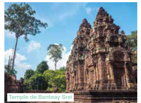
Temple de Banteay Srei

Départ pour une journée complète consacrée à Angkor. Le matin, visite du temple Banteay Srei. Surnommé « la citadelle des femmes », ce temple plat cerné de douves, est une merveille, édifiée au Xe siècle, dont l'aspect a conservé une remarquable fraîcheur. Prenant